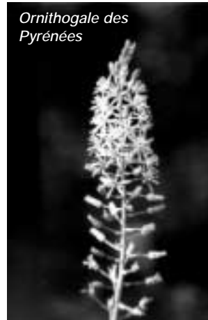
Ornithogale des Pyrénées

En redescendant à travers le bois qui occupe le vallon une belle population de parisette prospère.