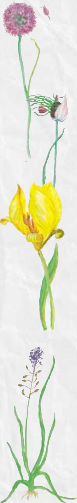
Les plantes des vignes