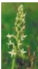
Orchis à deux feuilles