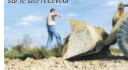
Dépose d'une plaque sur le site receveur