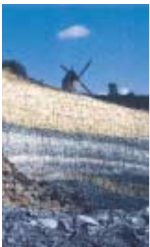
ANCA NOUVELLE Mai 2002 Conception & Réalisation : © Les Amis Naturalistes des Coteaux d'Avron

Aujourd'hui, notre partenariat avec la commune de MONTFERMEIL a permis d'aboutir à la signature d'une convention. Cette convention permettra un développement local en matière environnementale. Cette perspective est associée à notre volonté associative de faire connaître le patrimoine naturel départemental à travers l'éducation à l'environnement.