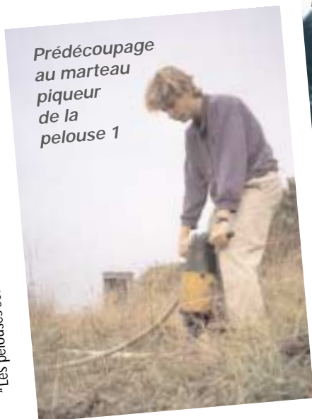
Prédécoupage au marteau piqueur de la pelouse 1