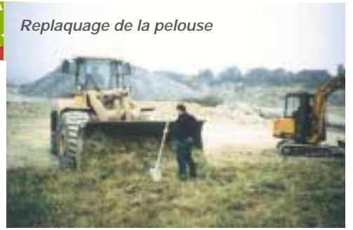
Replaquage de la pelouse