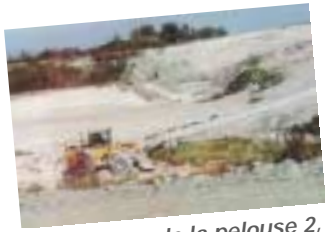
Déplaquage de la pelouse 2, à l'horizon à droite le site receveur, au loin à gauche la pelouse 1.

très favorable à l'extension de milieux naturels, c'est d'ailleurs ce qui a commencé spontanément à se produire.