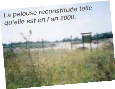
La pelouse reconstituée telle qu'elle est en l'an 2000.