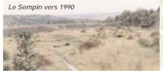
Le Sempin vers 1990

Un travail considérable d'inventaire et de sensibilisation du public a été mené par l'association depuis 1985.