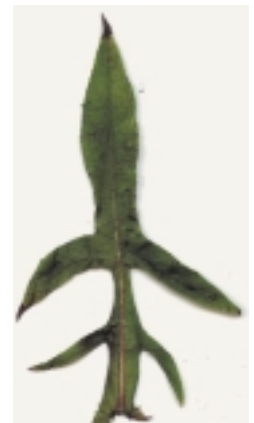
Laiteron des Marais