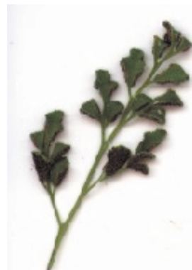
Rue des Murailles