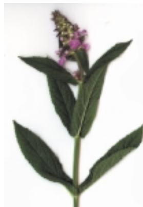
Épiaire des Marais