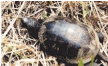
Cistude (Plan de la Tour - Var)

Le castor, réintroduit avec succès dans la Loire et qui ose même s'approcher des agglomérations comme Orléans ou Tours. Pourquoi pas des castors sur les berges presque pas habitées des boucles de la Marne de Jablines ou Meaux ? Cette espèce est bien plus rustique que l'on ne croit et nos berges qui n'ont jamais été aussi boisées, lui offriront nourriture et couvert. La tortue cistude déjà réintroduite dans des régions européennes bien plus nordique que la nôtre. Elle a même été relâchée au sud du Lac du Bourget (Savoie) entre 2000 et 2002.