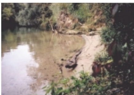
La Marne à Chessy (77)