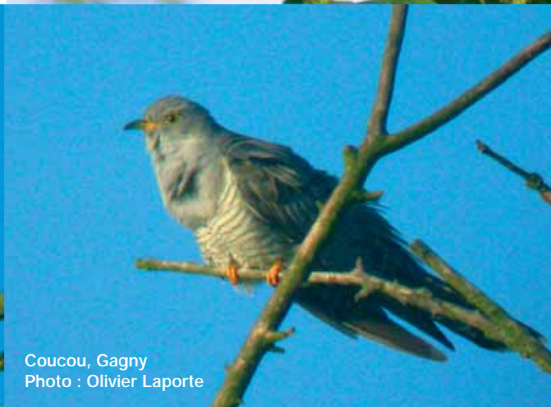
Coucou, Gagny