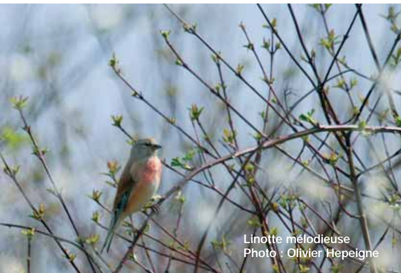
Linotte mélodieuse

La formation se termine. Elle aura été plus que bénéfique. Ça a été avant tout un séjour d'apprentissage de connaissances naturalistes mais aussi de rencontres.