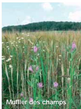
Muflier des champs

Les Sylvains sont les papillons forestiers par excellence, on les voit dans les clairières chaudes et ravins forestiers sur les ronces et le chèvrefeuille (dont la chenille se nourrit). La position des ailes est très rabattue ce qui donne des ailes fines pour un vol rapide et plané.