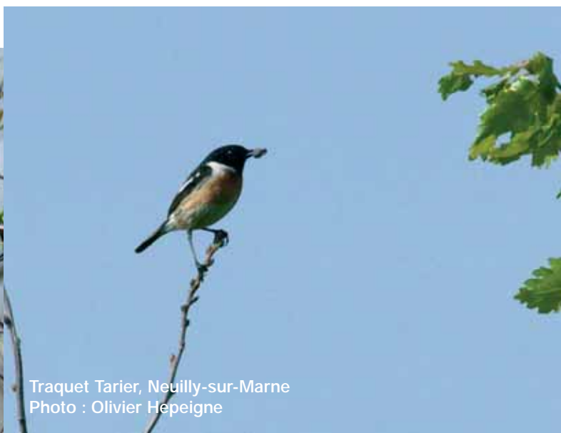
Traquet Tarier, Neuilly-sur-Marne