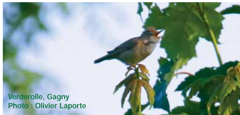
Verderolle, Gagny

Les enfants autant que les parents ont été très contents de ce stage, qui est le premier et pas le dernier, que l'ANCA compte faire.