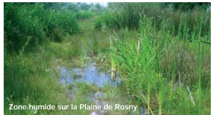
Zone humide sur la Plaine de Rosny

Les problèmes environnementaux non jamais été aussi importants qu'aujourd'hui et nous devons nous mobiliser pour la protection de la nature au Plateau d'Avron. Agir localement pour avoir un impact global sur notre Environnement.