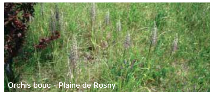
Orchis bouc - Plaine de Rosny