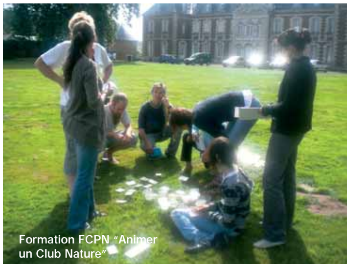
Formation FCPN "Animer un Club Nature"

Du samedi 15 aout 2009 au mercredi 19 aout 2009