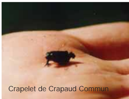
Crapelet de Crapaud Commun