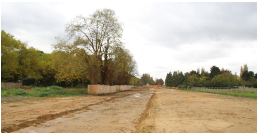
Vue de la partie Est du site (octobre 2017)

En effet, au fil du temps, les mesures préconisées pour réduire les impacts du projet sur la biodiversité ont progressivement disparu. Les travaux en cours n'ont plus aucune contrainte. Ils consistent à faire de la place pour construire, en arrachant les arbres et en terrassant toutes les surfaces en herbe.